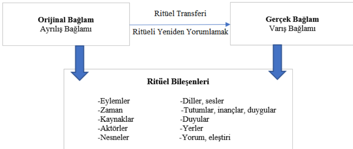
Şekil 1. Ritüel Transferi Modeli (Venhorst ve diğer., 2011: 170)

Bağlam yönleri, ritüelin iletişimi ve ritüel pratiğinin coğrafi, mekansal, ekolojik, kültürel, dini, politik, ekonomik ve sosyal çevresidir ve bu farklı bağlam yönlerinin birbirini etkileyebileceği bir bağlam değişikliği, ritüelin iç boyutlarında değişikliklere neden olur (Langer, 2011: 2). Ritüelin transfer süreci ise katılımcılar tarafından gerçekleştirilir (Langer, 2011: 2).