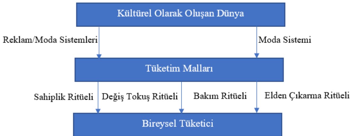
Şekil 2. Anlam Transferi Modeli (McCracken, 1986: 72)

Şekil 2'de görüleceği üzere tüketici anlamları; kültürel olarak oluşturulmuş dünya, tüketim malları ve bireysel tüketici olmak üzere tek yönlü bir yörüngede hareket etmektedir (McKechnie ve Tynan, 2006: 132). McCracken (1986), damlama/yayıma (trickle-down) teorisini diriltirerek, reklam ve moda sistemlerinin dünyadan mallara anlam aktarma araçları olarak nasıl hizmet ettiğini gösterirken, dört tür tüketim ritüelinin (sahiplik, değiş tokuş, bakım ve elden çıkarma) kültürel anlamları mallardan bireylere aktardığını belirtmektedir (McKechnie ve Tynan, 2006: 132). Tüketiciler, ritüeller aracılığıyla mallarla etkileşime girdiklerinde kültürel anlama, "benzersiz ve bireysel bir karakter" verilir (Fournier, 1991). McCracken gibi yapısalcı düşünürler, tüketim nesnelere ile bunların toplumsal anlamları ve kullanımları arasında birebir ilişki olduğu görüşüne katılmaktadırlar (McKechnie ve Tynan, 2006: 132).