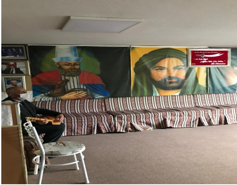
Resim 2.2.. Cemevi

Ankara'da bulunan cemevine ait fotoğraflar