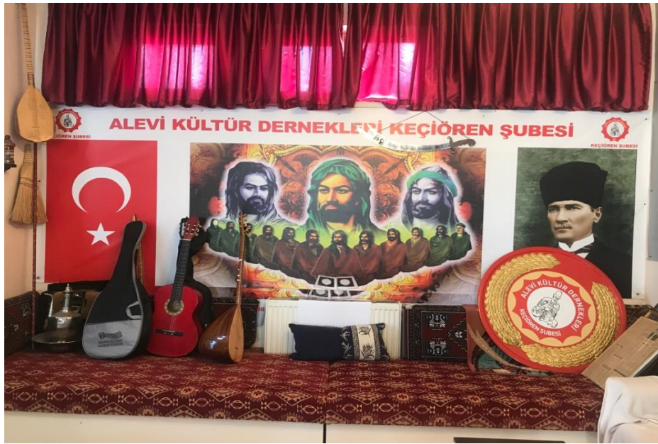
Resim 2.3. Cemevi