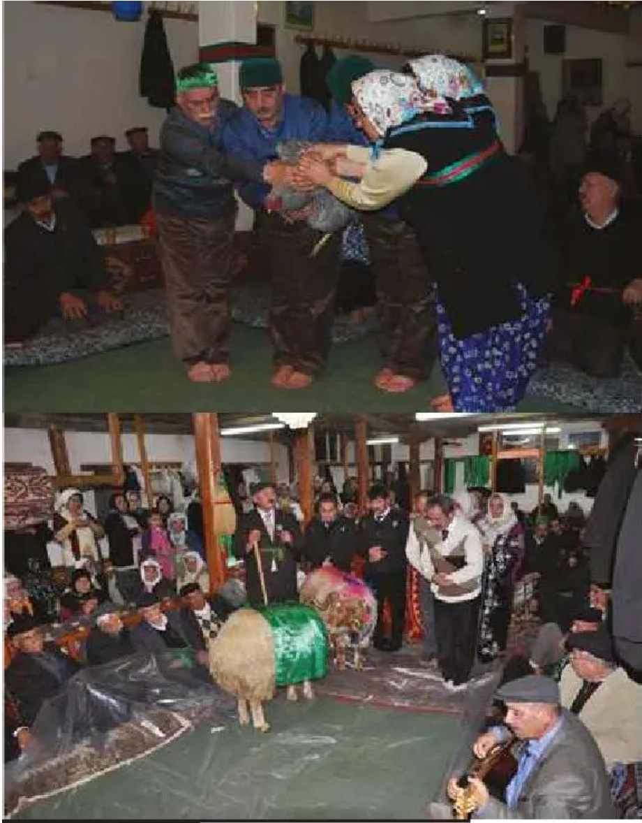
Resim 2.1. Cemde yapılan kurban ritüeli