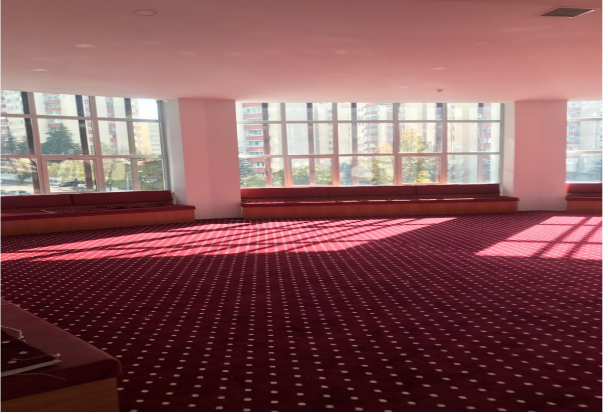
Resim 2.4.. Cemevi