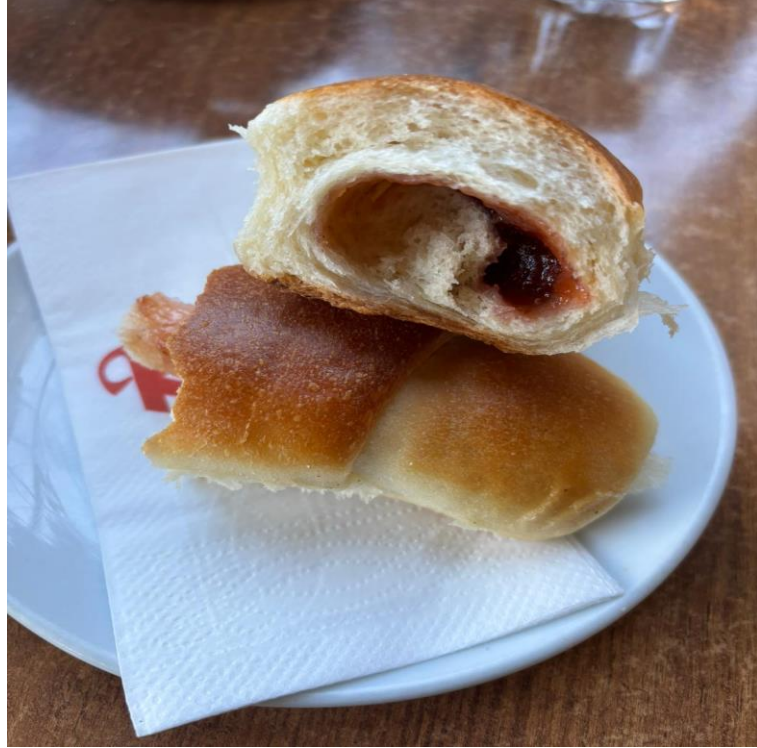
Şekil 4. 1. Kifla

Kifla, Milinka, Kozonak ve Tutmanik , bu dört ürünün her biri 11 katılımcının tamamı tarafından bilinmektedir. Bu oranlar, tatlı ve tuzlu çörek türlerinin bölgesel mutfakta yüksek bir kültürel sürdürülebilirliğe sahip olduğunu göstermektedir. K9'un “kozonak olmadan paskalya olmaz” yorumu, dini takvimle ilintili gıda üretiminin kültürel devamlılığına işaret eder. Tutmanik için K6'nın “ekşimik varsa tutmanik yapılır” vurgusu, malzeme ve iklim koşullarının üretim tercihlerine etkisini ortaya koymaktadır.