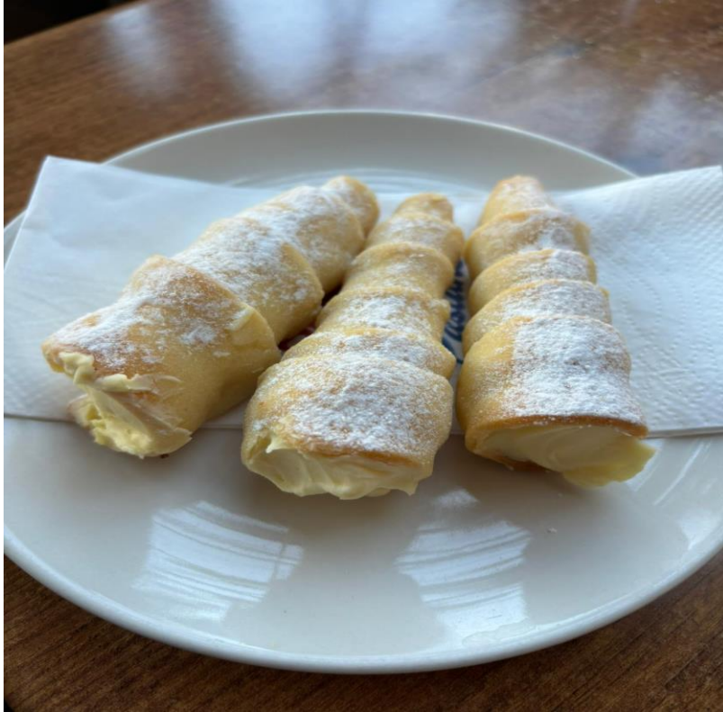
Şekil 4. 2. Funiyki

Baklava, Revani, Krem Karamel, Tikvenebanitsa, Funiyki ve Sütlaç gibi tatlılar, 11 katılımcının tamamı (K1–K11) tarafından ifade edilmiştir. Bu durum, bu tatlıların kuşaklar arası aktarımda yüksek düzeyde temsil edildiğini ve bu tatlıların hem Türkiye hem de Bulgaristan kökenli mutfaklarda ortak bir kültürel bellek taşıdığını göstermektedir. Özellikle Krem Karamel ve Tikvenebanitsa , hem Balkan hem de evrensel mutfak kültürüyle kesişen tatlılar olarak dikkat çekmektedir.