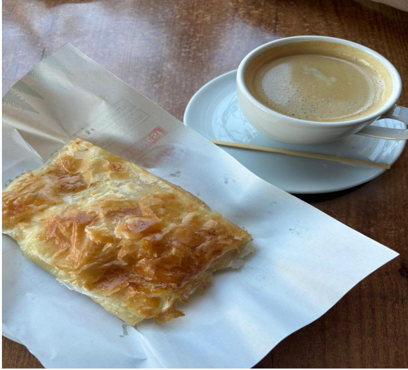
Şekil 4. 4. Banicka ile kahvaltı örneği

Banička, kifla, milinka ve tutmanik gibi hamur işlerinin kahvaltı kültüründeki merkezi konumu, göçmen topluluğun Balkan gastronomik mirasını sürdürdüğünü göstermektedir. Özellikle baniçkanın " yağlı yufka peynirli börek " olarak tanımlanması ve tüm katılımcılar tarafından belirtilmesi, bu yiyeceğin kahvaltı sofralarının vazgeçilmez bir unsuru olduğunu ortaya koymaktadır. Bu hamur işlerinin yaygınlığı, göçmen topluluğun beslenme alışkanlıklarında tahıl ürünlerinin önemini yansıttığı düşünülmektedir.