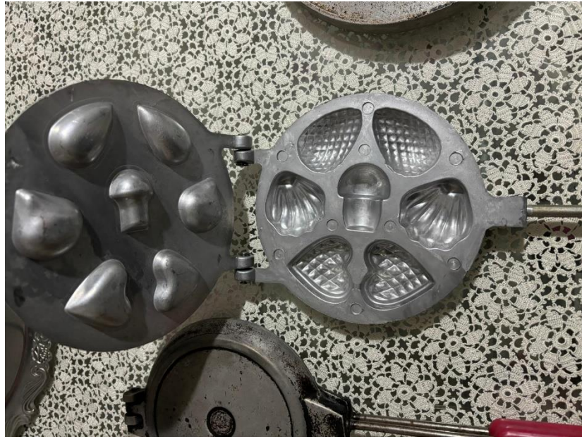
Şekil 4. 3. Kurabiye Tavaları

Yumurta tatlısı, Şekilli Kurabiyeler, Kabak Tatlısı, Sütlaç, Poniçka gibi tatlılar, katılımcıların %45 ila %82'si tarafından dile getirilmiştir. Örneğin, Yumurta tatlısı 11 katılımcıdan 6'sı (yaklaşık %55) tarafından ifade edilmiştir. Bu oran, tüm göçmen topluluk içerisinde aynı oranda yaygın olmadığını düşündürmektedir.