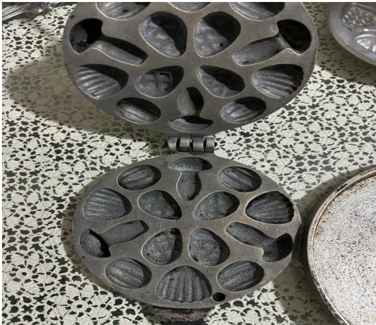
Şekil 4. 5. Kurabiye Tavaları-2

Malzeme erişim zorluğu sadece gıda maddeleriyle sınırlı değildir; özel mutfak ekipmanları ve pişirme araçlarına erişimdeki zorluklar da göçmenlerin geleneksel yemeklerini hazırlamalarını etkilemektedir. K1'in " Kurabiye tavaları burda yok " ifadesi, belirli mutfak araçlarının yokluğunun geleneksel yemeklerin yapımını nasıl etkilediğini göstermektedir. Benzer şekilde, K2'nin " Akıtma: Ilık su, kuru maya, az şeker, az tuz, un karıştırıyorsun krep hamuru gibi oluyor. Krepten farkı mayalanıyor olması. Biz toprak saçlarda pişirirdik. Şimdi tavada yağsız pişer üzerine tuzlu tereyağı konur " ifadesi, pişirme araçlarındaki değişimin yemeklerin hazırlanma tekniklerini nasıl dönüştürdüğünü ortaya koymaktadır. Bu ekipmanların yokluğu, belirli yemeklerin ya yapılamamasına ya da farklı tekniklerle hazırlanmasına neden olmaktadır, bu da kültürel adaptasyon sürecinin maddi boyutlarını göstermektedir.