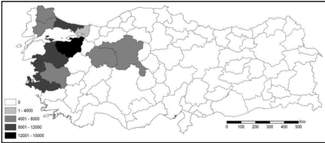
Şekil 2.2. 1950 – 1951 döneminde Türkiye'ye gelen göçmenlerin yerleştirildikleri iller

93 Harbi olarak bilinen 1877-1878 Osmanlı-Rus savaşı neticeye erince Osmanlı devletine karşı yoğun bir göç talebi oluşmuştur. Bu gelişmeye istinaden planlı bir çalışma yapılabilmesi adına göçmenlerin yerleşim kurabilecekleri yerler tespit edilmeye çalışılmıştır. Şekil 1 incelendiğinde Hüdavendigar(Bursa) vilayetinin bu konuda çalışma kapsamına dâhil olduğu görülmektedir.