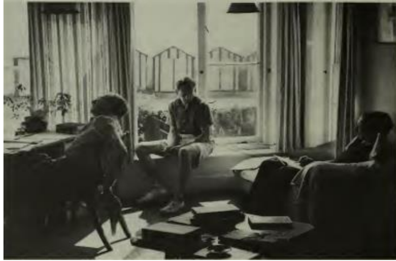
Resim 4.1. Forster, Britten ve Crozier, Aldeburgh'daki Crag House'ta Billy Budd'in librettosu üzerinde çalışırken, Ağustos 1949.

Libretto yazarı Forster ve besteci Britten'in ilk buluşmalarının ayrıntıları belirsiz olsa da, karşılaşmalarını sağlayan kişilerin karşılıklı arkadaşları Auden ve Isherwood olduğu konusunda şüphe yoktur. Isherwood, Forster'a özellikle yakındır ve onu hem profesyonel hem de özel hayatta bir rol model olarak görmektedir. Aynı zamanda hem bir yazar hem de bir eşcinsel olarak. İşte bu nedenle Forster'ın hayranları, Britten'ı Forster ile yakınlaştırmak için çaba göstermiştir. Britten'in Amerika Birleşik Devletleri'nde yaşadığı dönemde Forster, Britten'in, George Crabbe'in "The Borough" adlı eserinden esinlenerek bir opera besteleme kararında beklenmedik ancak son derece önemli bir rol oynamıştır. Britten, 1941 yazında California'da, Forster'ın "George Crabbe: The Poet and the Man" adlı bir konuşmasının metnini içeren Listener (29 Mayıs 1941) dergisinin bir kopyasına rastlamıştır. Bu makale, sadece Peter Grimes için hemen bir katalizör olmakla kalmamış, aynı zamanda bestecinin Amerika Birleşik Devletleri'ni terk edip İngiltere'ye dönme kararını da belirgin bir şekilde etkilemiştir (Redd, 1993).