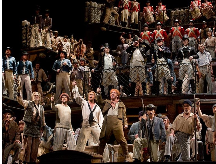
Resim 4.4. Indomitable gemisinde bir sahne

Librettonun zorluklarının başında, kadın seslerine ihtiyaç duymadan bir opera yapılması sorunu gelmiştir. Besteci bu tür zorluklardan beslenmiş ve bu durumu avantajına çevirmeyi başarmıştır (Resim 4.4). Budd'ın müzikal dili, Grimes'inkinden daha az gösterişli, renkli, daha ince ve nüanslıdır. Orkestrasyon büyük, yankılı farklı bölümlerden oluşmuştur. Britten, eserinde bakır ve nefesli çalgılara yönelmiştir. Britten'in oda orkestrasıyla deneyiminin etkisi de orkestral yazımda belirgin haldedir. Bu açıdan bakıldığında, kendi özgün ses dünyasıyla harika bir şekilde kurgulanmış, son derece hassas bir eserdir. Sahneleme olarak denizcilik yaşantısını olduğu gibi yansıtma amacı güdülmüştür (Resim 4.5). Diğer bir zorluk, libretto yazarı için çok önemli olan operanın ilk sahnesinde bulunan sis efektinin anlaşılması ve ahlaki karmaşayı ima ederken operaya müzikal amaç ve birlik kazandırmaktır (Resim 4.6). Opera aslında dört perde olarak tasarlanmıştır. Britten, bu düzenlemeyi 1960 yılında, hiçbir temel şeyi kesmeden olayların sıralamasını sıkılaştırarak iki perdeye dönüştürmüştür.