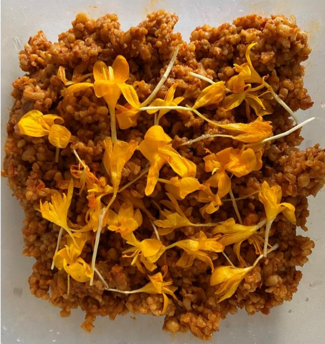
Resim 12 Çiğdem Pilavı –Reçete 3 (Soner Alper, 2021)