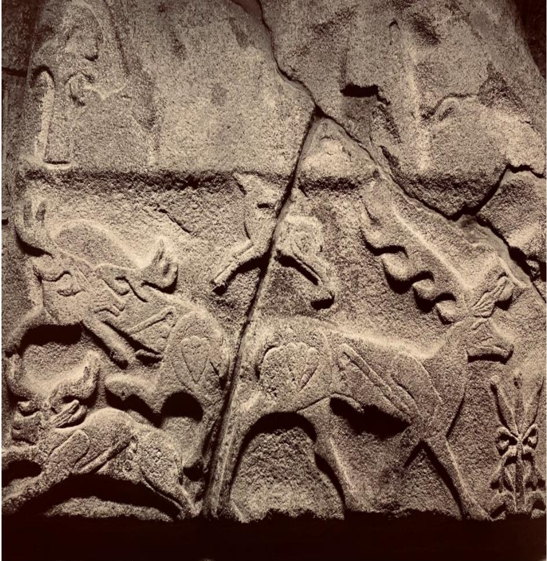
Resim 3 Alacahöyük Kabartması - AN.TAĖ.ŐUM SAR (Yazıcı, 2015)

AN.TAĖ.ŐUM SAR Bayramı Hitit merasimleri arasında en iyi bilinen, en geniş topraklarda kutlanan ve toplam 38 günle çok uzun süren bir ilkbahar bayramı türüdür ve son zamanlarda “Çiğdem Bayramı” demek adet olmuştur; bu bayram belki de Puőkurunuwa Dağı’nda kutlanan ve mahiyeti pek iyi bilinmeyen bir bayramın devamıdır ve doğa ve kır fetişlerine tapınma esasına dayalı çok eski bir Hatti geleneğine geri gitmektedir.