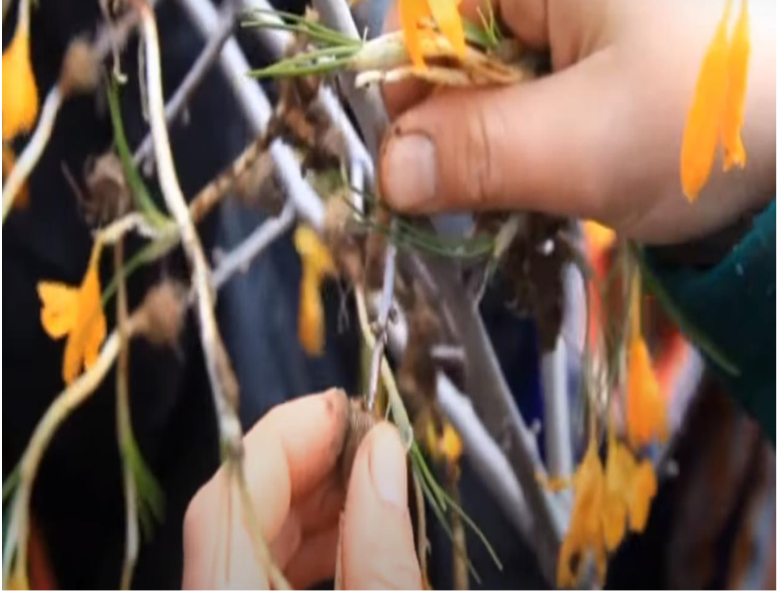
Resim 9 Çiğdem Gezmesi (Tunçtürk, 2016)

Son yıllarda gelenek bazı köylerde sadece hafızalarda yaşarken, bazıları da eski şekli ile devam etmektedir. Bazı köylerde ise geleneği yaşatmak için resmi kurumlar ve şahıslar tarafından yeniden canlandırma yapılmaktadır (Aydos, 2014).