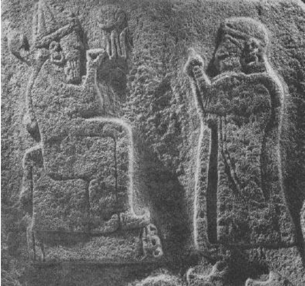
Resim 4 Alacahöyük Ortostatı (Yazıcı , 2015)

Bu karmakarışık bayramın belli başlı safhalarını özetleyerek sunan bir tablet vardır ve geriye kalan sayıları kabarık fragmanların düzenlenmesi ve sıralanması bu özeti esas alarak kabataslak da olsa yapılabilmektedir (Güterbock, 1960).