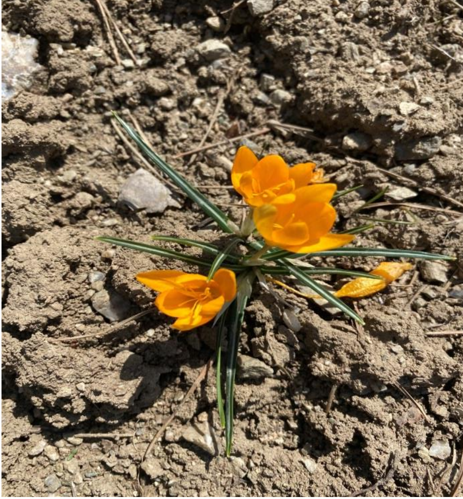
Resim 5 Çiğdem (Crocus) (Soner Alper, 2021)

Ana yurdu Güney Avrupa, Alpler ve Akdeniz olan Çiğdem, yumrulu çok yıllık, sarı ya da mavi çiçekli, türüne bağlı olarak çiçekleri ilkbahar veya sonbaharda açan, bahçecilikte aranan ve sevilen otsu bir bitkidir. İlkbaharda çiçeklenen türlerin, yumurtalığı toprak altında kalan uzun çiçek tüpleri vardır. Çiçekler, kötü havalarda ve geceleri kapanır (Ankara Valiliği Kültür ve Turizm İl Müdürlüğü, 2017). Çiğdem'in bir türü olan mor renkli ve hoş kokulu Crocus sativus L. 'den, tıbbi amaçlarla gıda renklendirici ve tat verici olarak kullanılan, dünyanın en pahalı baharatı unvanlı “safran” elde edilir.