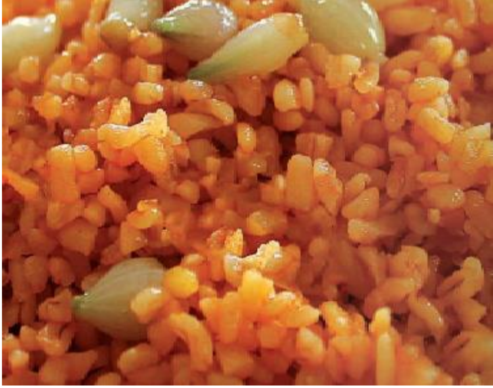
Resim 11 Çiğdem Soğanlı Bulgur Pilavı – Reçete 2 (Ankara Valiliği İl Kültür ve Turizm Müdürlüğü, 2012)

karıştırılarak 15 dakika kısık ateşte demlendirildikten sonra tabağa alınarak servis yapılır (Ankara Valiliği İl Kültür ve Turizm Müdürlüğü, 2012).