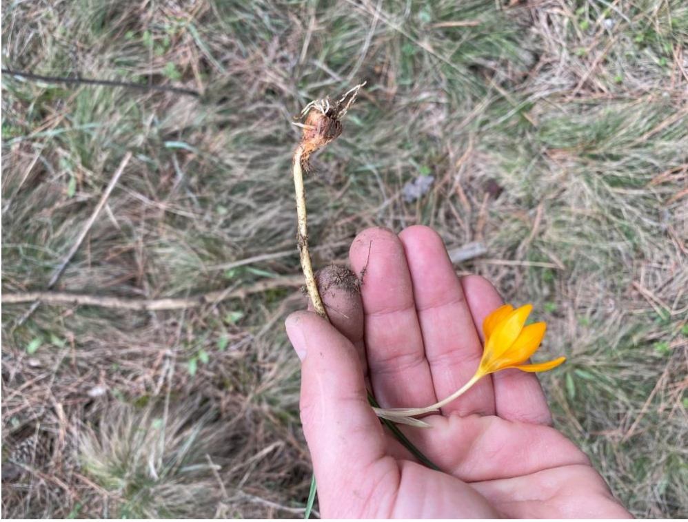
Resim 8 Çiğdem Çiçeği ve Soğanı (Soner Alper, 2021)

Yaş gruplarına göre benimsenin bayramlardan olan ve çocuklarla kutlanan “Çiğdem Pilavı” erkek çocukların bayramıdır (Boratav, 2016). Çeşitli adlarla anılsa da kutlamanın özünün, mevsimsel olarak kıştan bahara geçişin habercisi olan kır çiçeklerinin çıkmasını, takvimsel olarak yeni yıla giriş olarak görme ve bunu genellikle yaşları 6-12 arası değişen çocukların eli ile bir şenliğe dönüştürme olduğu ifade edilebilir (Oğuz, 2014).