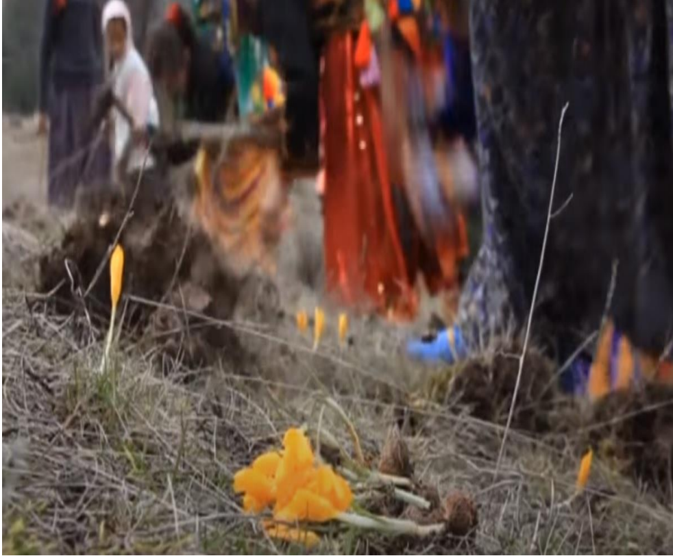
Resim 7 Çiğdem Gezmesi (Tunçtürk, 2016)

Anadolu’da yüzyıllardır süregelen çiğdem sevgisi ve her bahar çiğdemlerle yapılan eğlencelerin Hititlerde de düzenlendiği anlaşılmakla, Anadolu’da yapılan çiğdem eğlencelerinin Hititlere uzanan bir tarih olduğu ve ritüelin Hititlerden günümüz Anadolu’suna miras kaldığı söylenebilir.