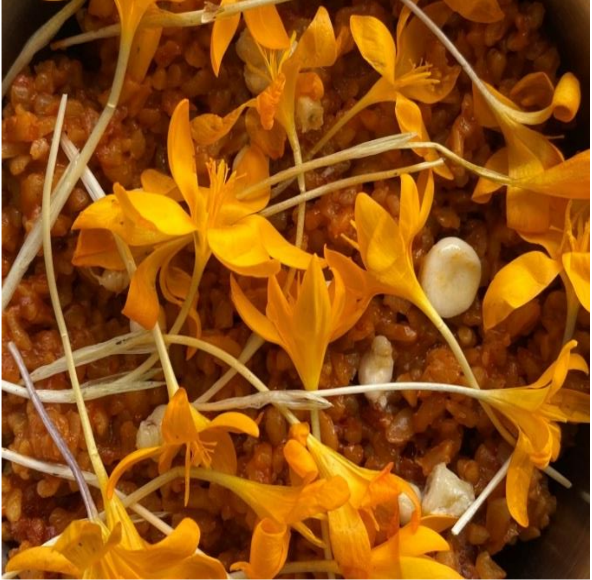
Resim 10 Çiğdem Pilavı – Reçete 1 (Soner Alper, 2021)

Olmayan Kültürel Mirasın Korunması Sözleşmesi'ni kabul etmiş, Türkiye de 2006 yılında bu sözleşmeye taraf olmuştur. Bu kapsamda “somut olmayan kültürel miras ulusal envanteri” ve “yaşayan insan hazineleri envanteri” oluşturulmuş, “Çiğdem Pilavı” da Türkiye somut olmayan kültürel miras ulusal envanterine, 01.0071 envanter numarası ile 2014 yılında kayıt edilmiştir (T.C. Kültür ve Turizm Bakanlığı, 2014).