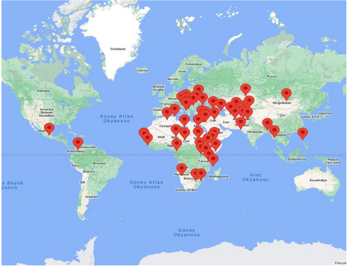
Harita 1. TİKA'nın Yurtdışındaki Koordinasyon Ofislerinin Ülkelere Göre Dağılımı 203

Türk İşbirliği ve Koordinasyon Ajansı Başkanlığı bugün 61 ülkede 63 Program Koordinasyon Ofisi ile 150 ülkede faaliyet göstermektedir. 204 TİKA'nın faaliyetleri başta dış politikayı çeşitlendirerek yumuşak güç üretmekte ve kamu diplomasisi alanında dış