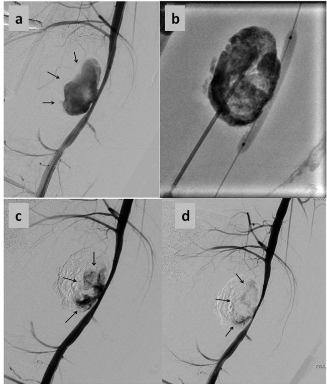
Resim 2. Trombin enjeksiyonu sonrası anevrizmada sadece parsiyel embolizasyon izlendi (oklar) (A), Perkütan translüminal angioplasti balon dilatasyon kateteri anevrizma boyununda şişirilerek anevrizma kesesine perkütan girildi ve balon remodelleme yardımıyla glue embolizasyonu uygulandı (B), Glue embolizasyonu sonrası kontrol anjiyografide anevrizma boyun kesiminde dolumun devam ettiği görüldü (oklar) (C), Balon tekrar şişirilerek anevrizma akımı 5 dakika süre ile kesildikten sonra alınan kontrolde ilkinde göre azalmakla birlikte halen kese dolumu devam ettiği görüldü (oklar) (D).