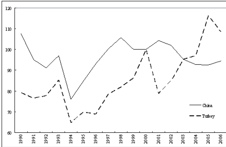
Şekil 2 - Reel Efektif Döviz Kurları- Türkiye ve Çin (2000 = 100)