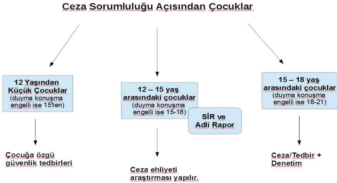
Şekil 2. Ceza sorumluluğu açısından çocuklar †

Ülkemizde çocuklar ile ilgili alınan tedbirlerde çocukların psikolojik ve fizyolojik durumları göz önünde bulundurularak yaş aralıkları belirlenmiştir. 12 yaşından küçük çocuklar ve duyma konuşma engelli çocuklar (15 yaşından küçük) hakkında çocuğa özgü güvenlik tedbirleri uygulanır. Bunlar bakım, sağlık, koruma, eğitim ve danışmanlık tedbiri olarak karşımıza çıkmaktadır. 12-15 yaş arasındaki çocuklar (duyma, konuşma engelli ise 15-18 yaş arası) hakkında sosyal inceleme raporları ve adli raporlar aracılığı ile ceza